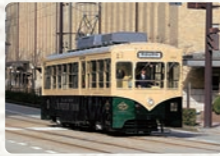
관광열차 (레트로 전차)