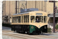
观光列车(复古电车)