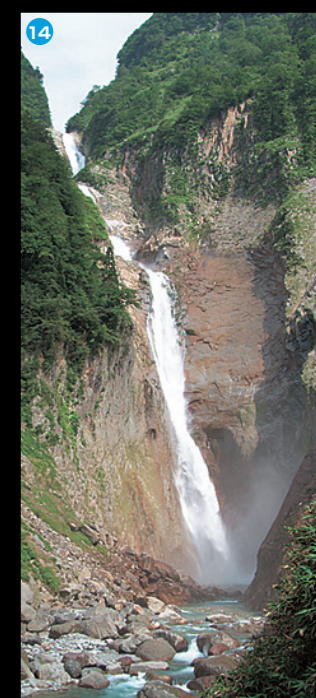
14 称名滝 日本一の落差350mを誇ります。