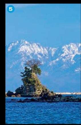
5 雨晴海岸 立山連峰が美しい眺めの海岸。