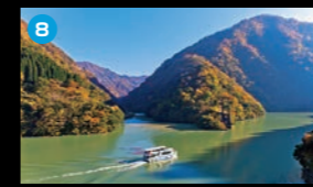
8 庄川峡 小牧ダムを中心とする庄川峡。四季折々の絶景を遊覧船で楽しめます。