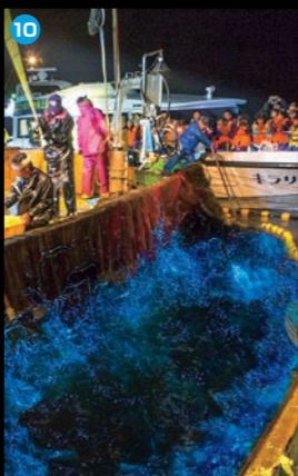
10 ほたるいか海上観光 4月上旬～5月上旬、観光船に乗ってホタルイカ漁を見学できます。