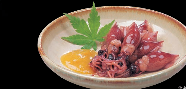
ホタルイカの釜揚げ