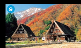
9 世界遺産 五箇山合掌造り集落 昔話に出てくるような景色が見られる、相倉と菅沼の2つの集落があります。