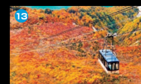
13 立山ロープウェイ 立山黒部アルペンルート内を運行する、日本最長のワンスパンロープウェイ。