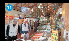
11 魚の駅「生地」 水揚げされたばかりの旬の魚が即売コーナーに並びます。