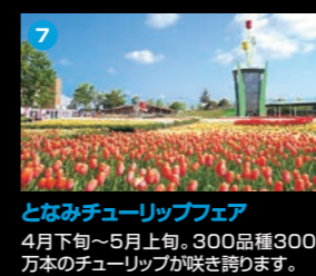
7 となみチューリップフェア 4月下旬～5月上旬、300品種300万本のチューリップが咲き誇ります。