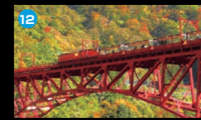
12 黒部峡谷 トロッコ電車 日本一深いV字峡谷。手つかずの大自然をトロッコ電車を楽しめます。